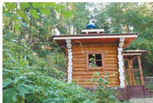
Часовня возле пещеры, где жил Трифон Вятский

нии дома паломников. Трудимся и отдыхаем, сочиняем песни о том, как нам здесь весело и дружно. Очень интересно общаться. Паломники, кстати, постоянно заходят. Бывает в день чело- век по сто. К рабо-